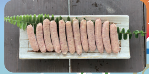
金あぐーウインナー(12本) ¥2000