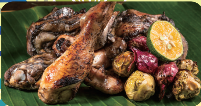
チャンプチキン(要事前予約) ¥2500

やんばるの豊かな大地で、ハーブを餌にのびのびと平飼いで育った、やんばるハーブ若鳥に、CHAMP CHICKEN 独自発酵の熟成黒塩麴を漬け込み、アミノ酸、酵素のパワーで柔らかく、しっとり焼き上がります。骨付きぶつ切りの部位は旨みが強く、臭み無くお楽しみ頂けます。BBQの際には十分加熱してお召し上がり下さい。※ポテト等副菜は付属しません。※ご提供は生肉となります。※写真は調理後のイメージです。