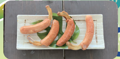
骨付ウインナー(4本) ¥600