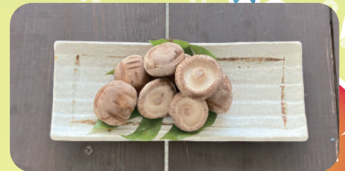
金武町産しいたけ(150g) ¥500